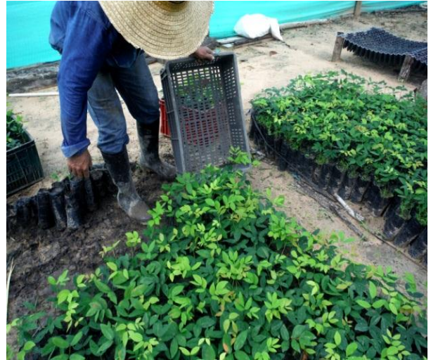
Plántulas de Aceite en el vivero de La Pedregoza

Presiones: Copaifera pubiflora , al igual que otras especies de árboles nativos valiosos, ha sufrido de la tala sin plantarlo de nuevo. Debido a su exquisita corteza amarilla, se han plantado algunos en áreas urbanas como árbol ornamental, pero las únicas siembras de Aceite en el Vichada son los que han tenido lugar en La Pedregoza , como parte del Proyecto Vida Silvestre , financiado por Ecopetrol y coordinado por WCS Colombia. Sigue existiendo la tala de árboles de bosques naturales debido a su fina madera, la cual se usa para hacer muebles y artesanías. Usar Aceite por su aceite parece ser una buena razón para promover su cultivo y esto podría ayudar a largo plazo al reducir la presión sobre la especie.