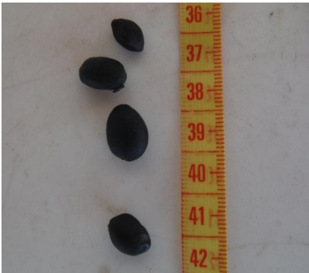
Semillas del Aceite y sus vainas

Recomendaciones: La conservación de este árbol en la Orinoquia es importante como fuente de alimento para la fauna local. Las semillas son esparcidas por hormigas y mamíferos como dantas y murciélagos. Debido al fino grano de su madera es una especie forestal prometedora y podría reemplazar plantaciones de árboles introducidos. Su tolerancia a diferentes condiciones de crecimiento podría ofrecer algunas soluciones económicas en áreas bajas. Dada a la dependencia del planeta por los combustibles fósiles, el árbol podría proporcionar a las personas locales una fuente de combustible renovable. Se requieren más estudios para conocer los múltiples usos medicinales del árbol. En La Pedregoza nos dedicamos a aprender cual es la mejor manera de cultivar y conservar este increíble y hermoso árbol.