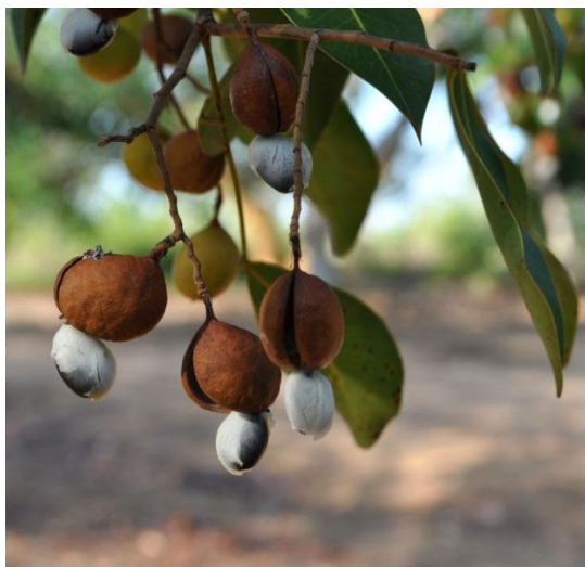
Semillas del Aceite y sus vainas

Crecimiento: A pesar de que el aceite tiene una madera densa, es un árbol de rápido crecimiento, lo que lo hace una opción prometedora para usar en plantaciones. Se han observado troncos de 30 cm de diámetro en árboles de solo 5 años de edad. Combinar el crecimiento relativamente rápido con el hecho de que este árbol es tolerante tanto a bosques de inundación y sabanas bien drenadas podría tener gran valor económico si se cultiva. Un estudio en Venezuela indicó que el árbol se siente cómodo en grandes densidades, pero que necesita distancia entre ellos para poder madurar. Se observó que otros Aceites que estaban cerca de árboles maduros no eran muy viejos. Las semillas son relativamente fáciles de coleccionar y se pueden encontrar lejos de los árboles paternos gracias a los murciélagos que dejan las semillas en el guano . Parece que lijar las semillas aumenta el porcentaje de germinación. Una vez germinadas, las semillas muestran un rápido crecimiento en el vivero y pueden ser plantadas con 3 meses de germinación.